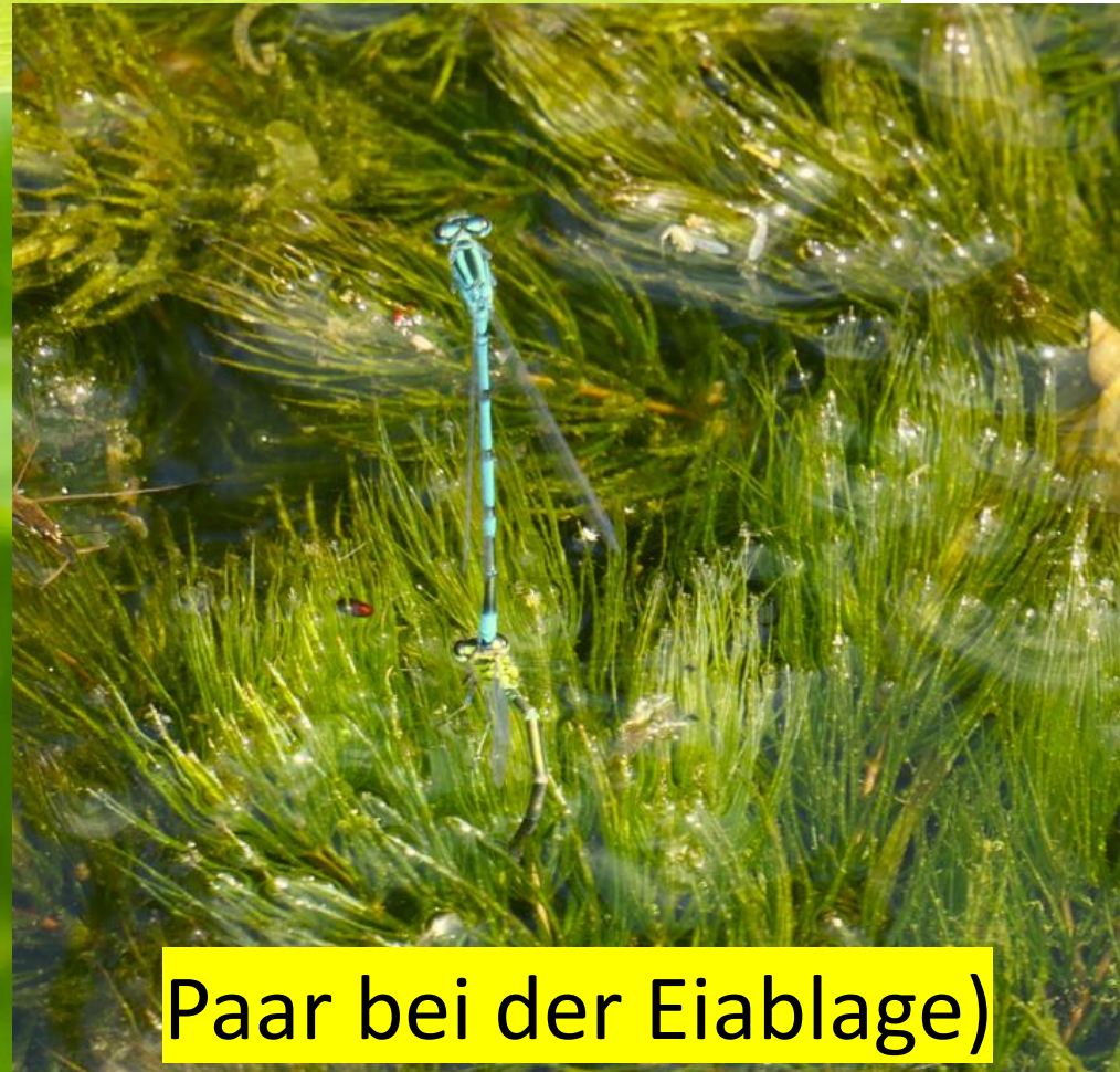
Paar bei der Eiablage)