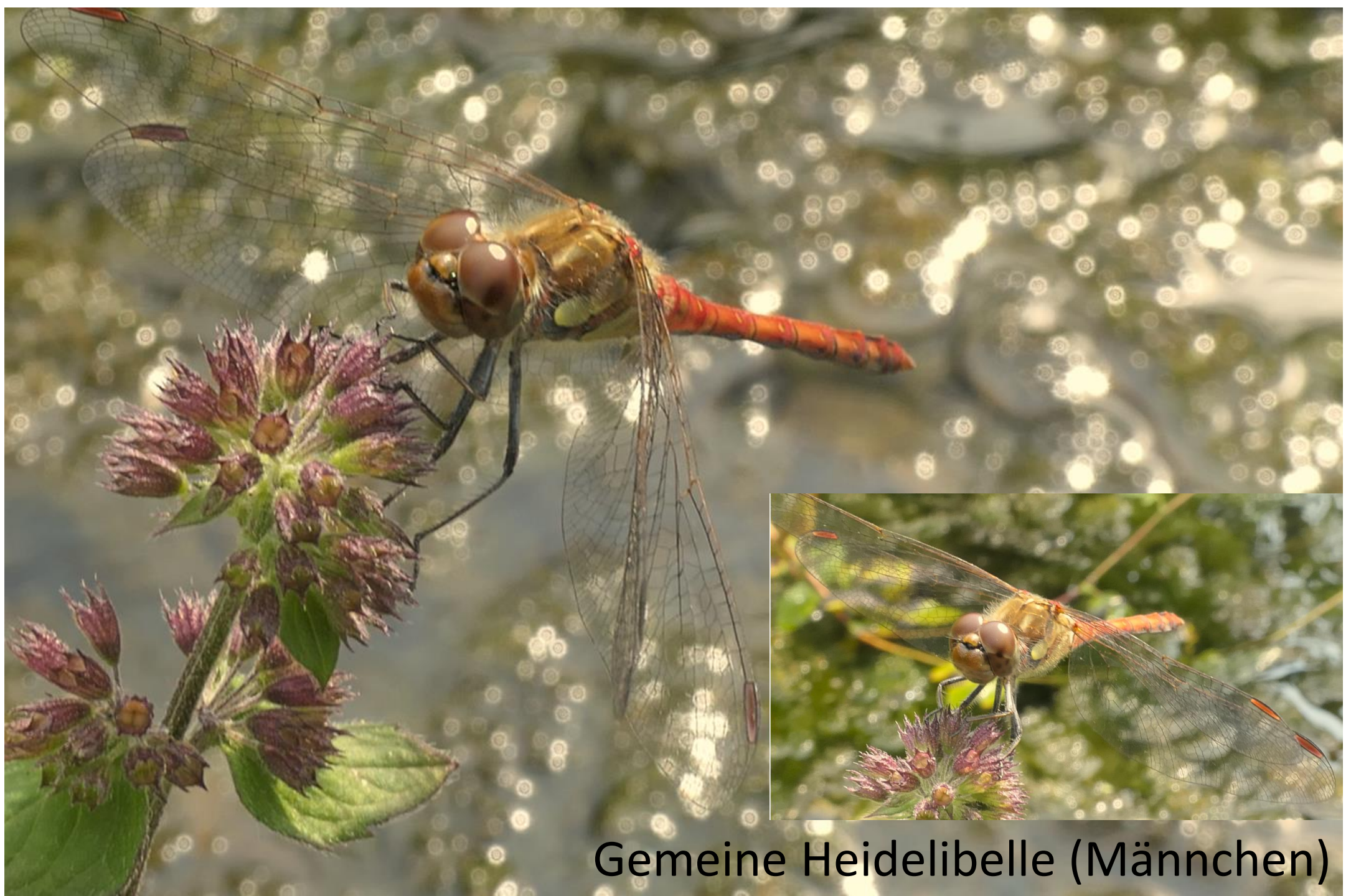
Gemeine Heidelibelle (Männchen)