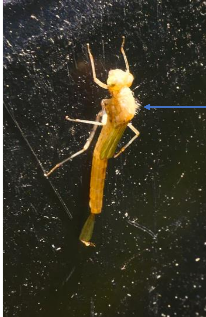
2. An dieser Stelle drückt die Libelle von innen an die Larvenhaut