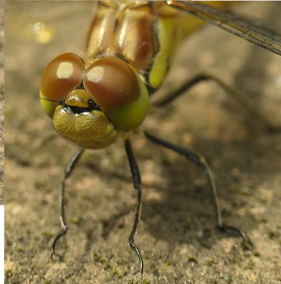
Gemeine Heidelibelle (Weibchen)