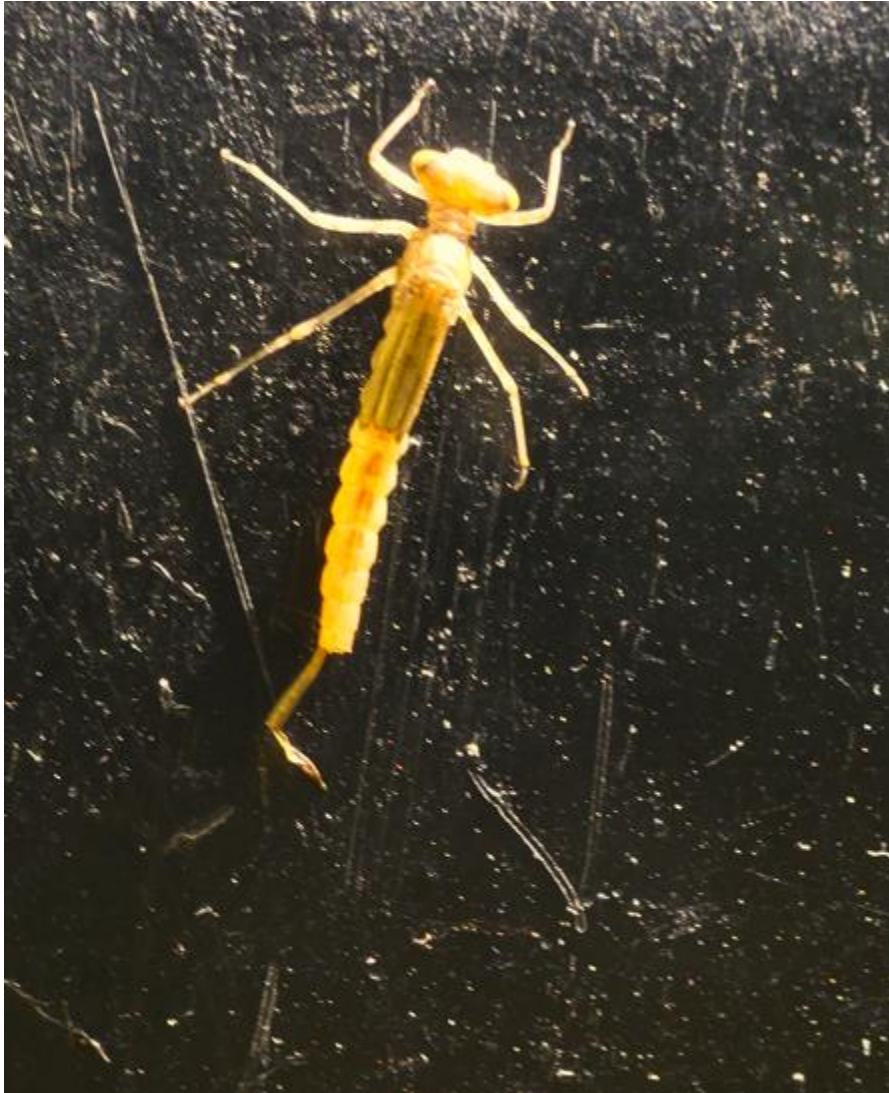
1. Libellenlarve verlässt das Wasser